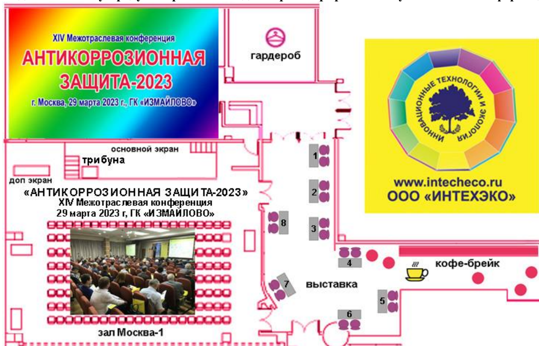
Схема выставки при конференции «АНТИКОРРОЗИОННАЯ ЗАЩИТА-2023»: (вход на выставку предусмотрен только для зарегистрированных участников конференции)