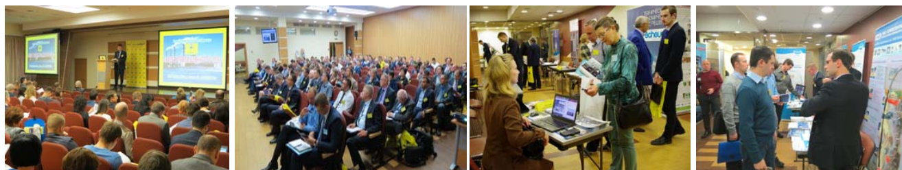
График промышленных конференций ООО «ИНТЕХЭКО»:

27 марта 2018 г. - X Международная конференция МЕТАЛЛУРГИЯ-ИНТЕХЭКО-2018