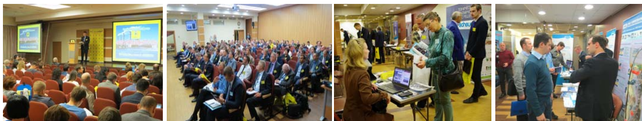
График промышленных конференций ООО «ИНТЕХЭКО»:

27 марта 2018 г. - X Международная конференция МЕТАЛЛУРГИЯ-ИНТЕХЭКО-2018