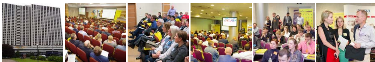
График промышленных конференций ООО «ИНТЕХЭКО»:

24 марта 2020 г. – XII Международная конференция МЕТАЛЛУРГИЯ-ИНТЕХЭКО-2020