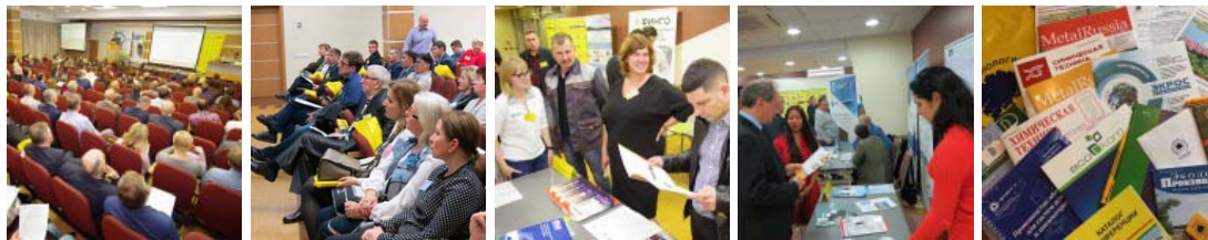
График конференций ООО «ИНТЕХЭКО»:

24-25 сентября 2019 г. - XII Международная конференция ПЫЛЕГАЗООЧИСТКА-2019 29 октября 2019 г. - X Межотраслевая конференция ВОДА В ПРОМЫШЛЕННОСТИ-2019 27 ноября 2019 г. - X Межотраслевая конференция АВТОМАТИЗАЦИЯ ПРОИЗВОДСТВА-2019