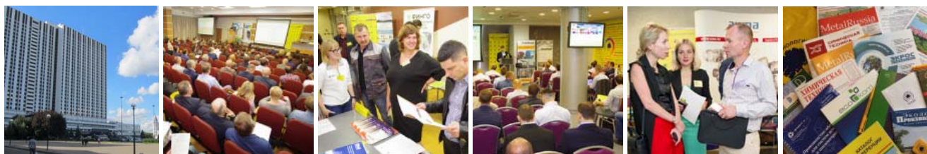
График промышленных конференций ООО «ИНТЕХЭКО»:

29 сентября 2020 г. - XIII Международная конференция ПЫЛЕГАЗООЧИСТКА-2020 (заочно)