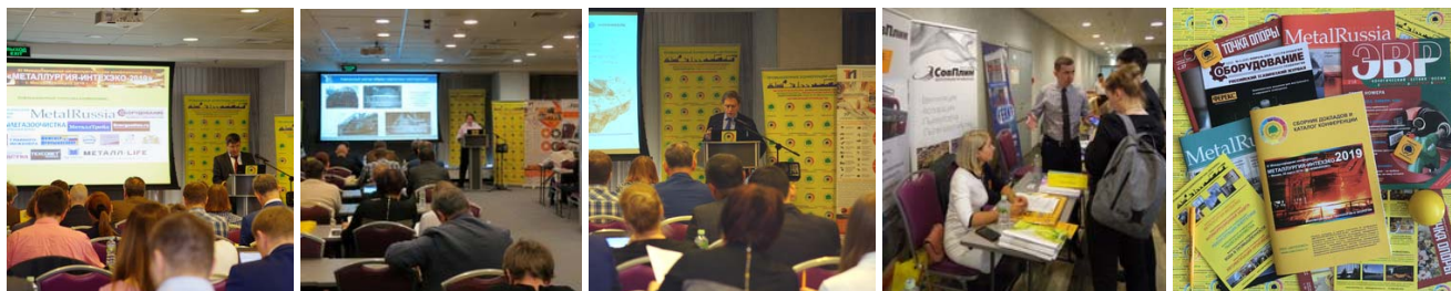
Состав участников конференций ООО «ИНТЕХЭКО»:

Состав участников конференции: руководители и ведущие специалисты металлургических предприятий - Главные инженеры, Главные энергетики, Главные экологи, Главные технологи, начальники цехов и проектных отделов, начальники отделов охраны окружающей среды, начальники установок газоочистки и водоочистки, ответственные за модернизацию и экологию производств; руководители и эксперты компаний-производителей и разработчиков экологических технологий и оборудования для решения экологических задач в металлургии, проектных, инжиниринговых и сервисных организаций.